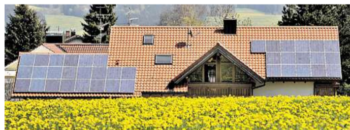
Wenn die Sonne scheint, sollten Solaranlagen ihre volle Leistung bringen.

Berlin. Es ist Sommer, die Sonne scheint – aber der Ertrag der Solaranlage ist nicht so hoch, wie er sein sollte, dadurch verliert der Hausbesitzer Geld. Ein Defekt kann die Ursache sein. Wie viel Leistungsverlust ist noch im Rahmen?